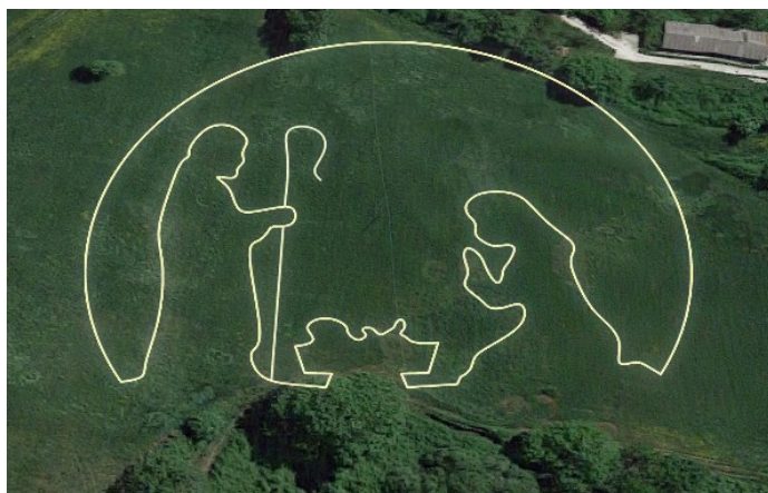
2° Edizione 2022/23 Artista Silvestro Serra